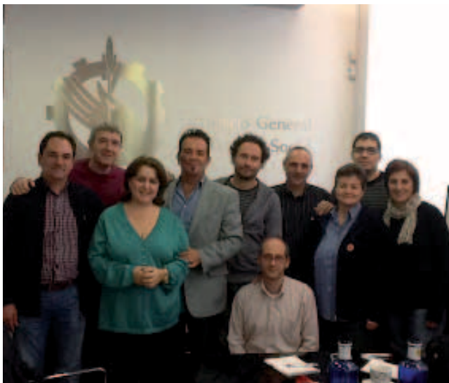
Foto: Consejo General (2012) Participantes del encuentro de blogueros

Entre las diferentes conclusiones del encuentro se sitúa la de difundir y dar a conocer los espacios, como indicaba anteriormente, que en estos momentos existen y que son gestionados/administrados por trabajadoras/es sociales, siendo consciente que con seguridad hay más compañeras/os que disponen de algún blog y o espacio web pero que en estos momentos no los conozco, de ahí que este artículo también va a servir para dar a conocer la iniciativa y que aquellas personas que así lo deseen se pongan en contacto con el Consejo General a fin de incorporarlos a un apartado específico que se generará en la web oficial del Consejo.