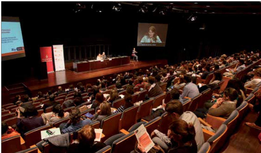
Projecto Social Innovation for Comunnities1_Roger Fonts (2013).