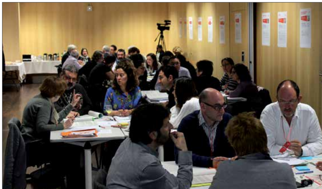
La Casa de las Ideas2 (2013).

Elaboración de proyectos sobre la base de las propuestas semifinalistas: entre el 10 y el 27 de mayo, los autores de las propuestas semifinalistas trabajaron en sus respectivas ideas con la ayuda de sugerencias y comentarios de otras personas participantes, siguiendo el enfoque abierto del proceso. Con el objetivo de generar sinergias y reflexiones que mejoraran las propuestas y facilitar un espacio de consulta con varios expertos en vivienda -especialistas en urbanismo, mercado inmobiliario, recursos y demandas, derecho inmobiliario y mediación residencial- el 16 de mayo tuvo lugar un taller de trabajo, que fue muy bien valorado por los participantes.