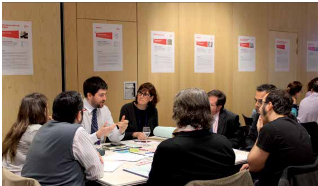
La Casa de les Idees 1 (2013).

y conceptualizadas por la ciudadanía que aporten soluciones al problema de la vivienda. Dicha comisión, llamada mixta, abarca a dos sectores, el público y el social, formado por la sociedad civil, tercer sector, consejos de barrio, asociaciones de vecinos, etc., y que participan trabajando en la búsqueda de soluciones específicas para solucionar la problemática.